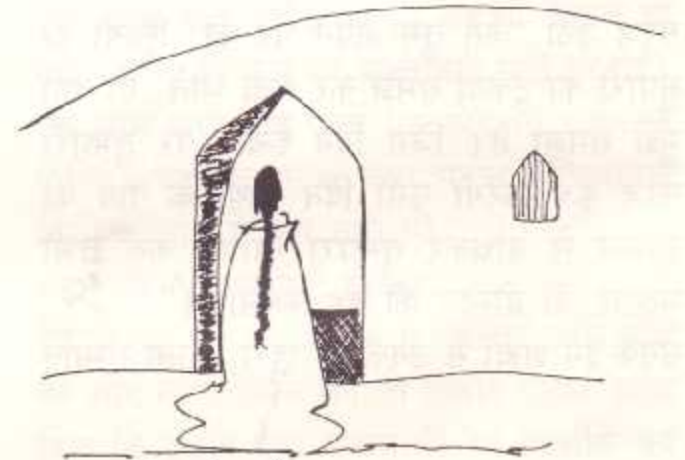
साभार अगेंस्ट ऑल औड्स

यह समस्या आज निम्न व मध्यम वर्ग तक ही सीमित नहीं रह गई है। आज अनेक घरों में आर्थिक तनाव के कारण पारिवारिक जीवन कलहपूर्ण हो रहा है। यही नहीं परिवारों के टूटने का कारण भी बन रहा है। एक मनोवैज्ञानिक डॉ. कोठारी ने बताया कि उनके यहां एक डाक्टर दम्पति का केस आया। पति घर में एक पैसा भी नहीं देता था। अपनी सारी कमाई को वह अपनी निजी संपत्ति मानता था।